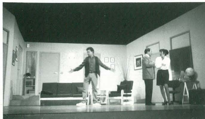
27 d'octubre. "Boeing-Boeing". Elenc Artístic Arbocenc de l'Arboç

Nota de premsa apareguda al Diari de Tarragona, novembre 1996