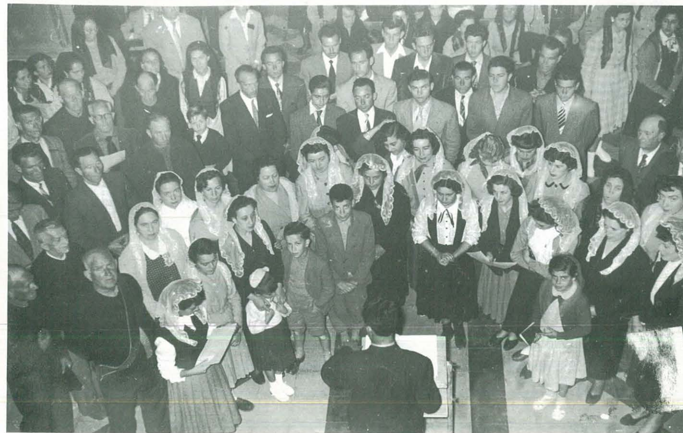
ORFEÓ ULLDECONENC. Foto retrospectiva finals dècada dels anys 50