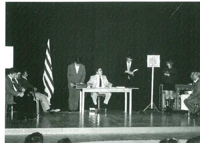
24 de novembre. "Un pont al riu". Delta Teatre de Deltebre i Tempo de Sant Jaume d'Enveja