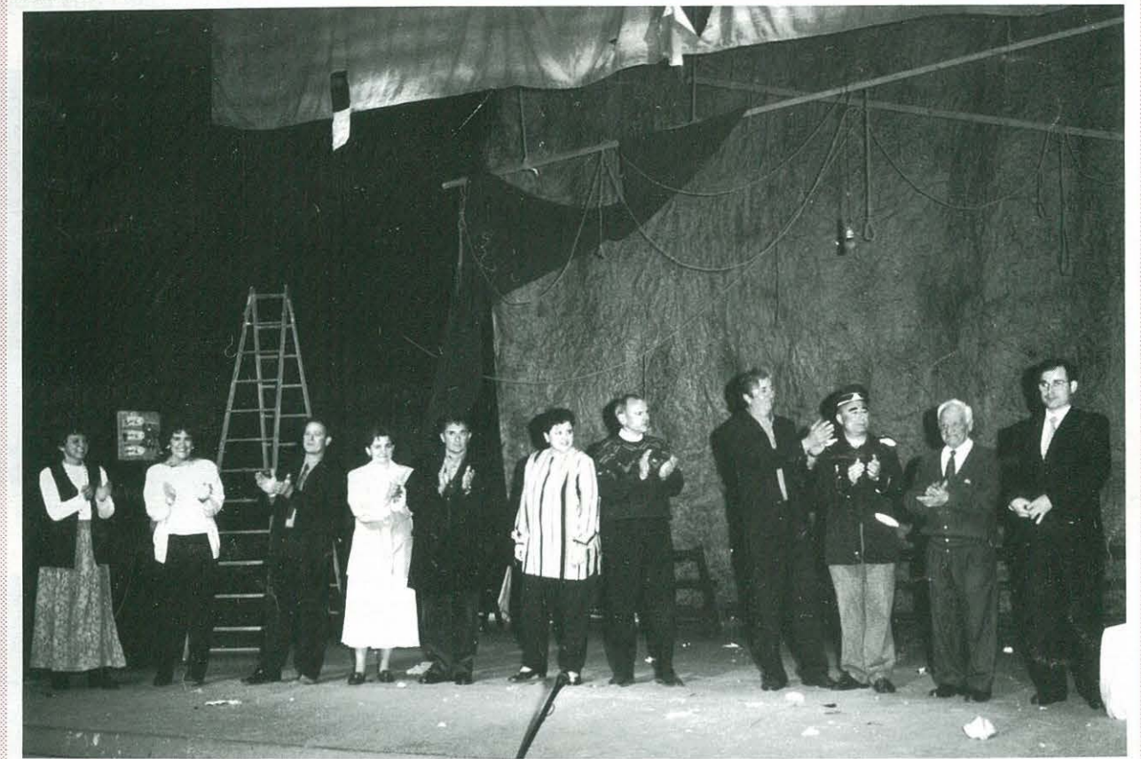
"PERDUTS EN EL TEMPS" Obra que donà fi a les XIV Jornades de Teatre

CLOENDA XIV JORNADES DE TEATRE Pàgs. 2-3