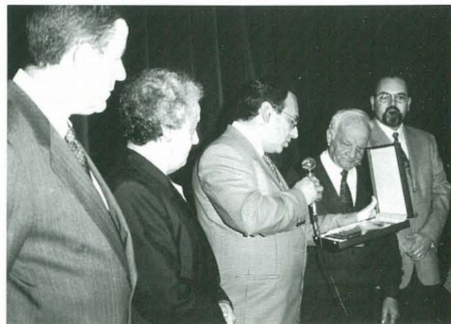
Autoritats i col.laboradors en l'acte d'acomiadament de les XIV Jornades de Teatre