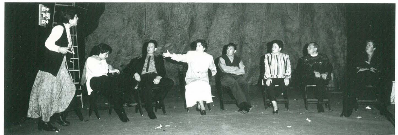
Components del Grup de Teatre del Centre Cultural i Recreatiu d'Ulldecona