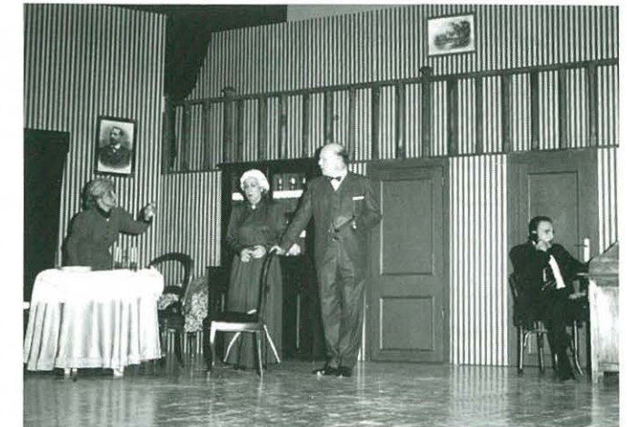
17 de novembre. "Arsènic i puntes de coixí". Acte Quatre G.T. de Granollers