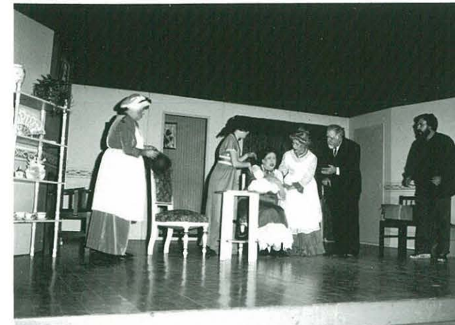
10 de novembre. "Història d'un mirall". S.F. 87 de Reus