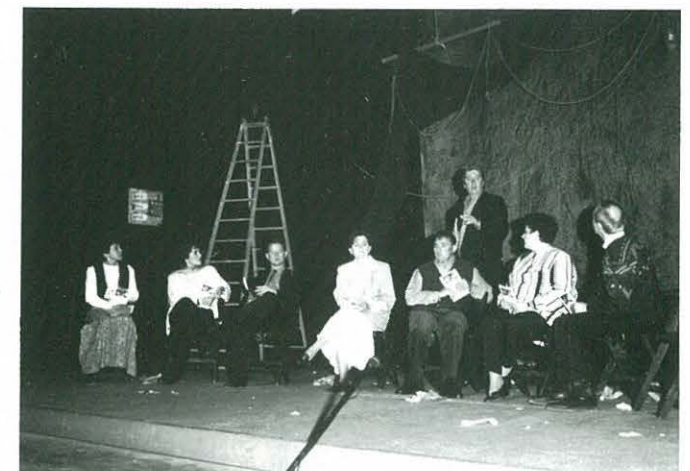
1 de desembre. "Perduts en el temps". G.T. Centre Cultural i Recreatiu d'Ulldecona